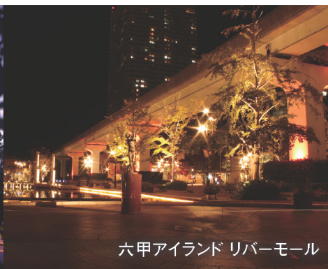
六甲アイランド リバーモール