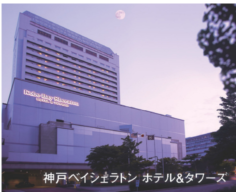
神戸ベイシエルトン ホテル& Towers